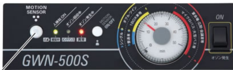
モーションセンサー

多数のユーザー様にご使用いただいている客室、車両での使用をよりわかりやすくしました。女性スタッフでも簡単に操作可能です。